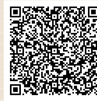
DECLARACIÓN UNIVERSAL DE LOS DERECHOS HUMANOS