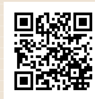
COMISIÓN INTERAMERICANA DE LOS DERECHOS HUMANOS