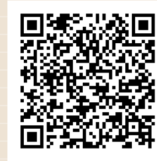
CONVENCIÓN AMERICANA SOBRE LOS DERECHOS HUMANOS