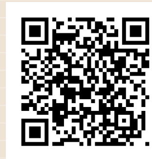
CONSTITUCIÓN POLÍTICA DE LOS ESTADOS UNIDOS MEXICANOS