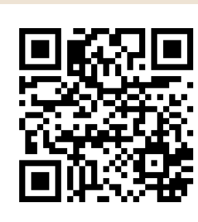
PROCURADURÍA DE LOS DERECHOS HUMANOS DEL ESTADO DE GUANAJUATO