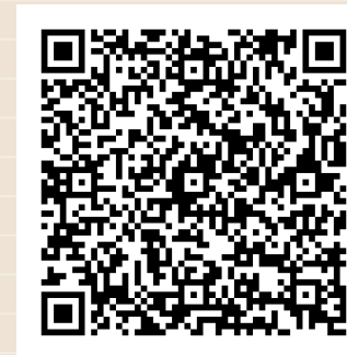
LEY PARA LA PROTECCIÓN DE LOS DERECHOS HUMANOS EN EL ESTADO DE GUANAJUATO